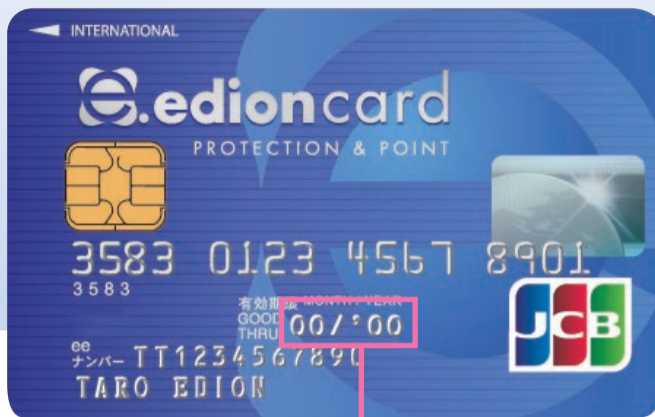
お手持ちのカード